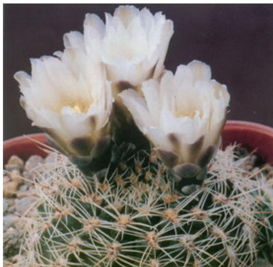
Figure 4 : Gymnocalycium albispinum , un G. bruchii muni d'une tige large.

aussi en trouver de 100 à 300 m d'altitude, au Paraguay. Je n'ai eu de problèmes du fait de basses températures qu'avec très peu d'espèces. Je pense notamment à G. chiquitanum , G. pediophilum et G. mihanovichii . Il semble cependant que les plantes adultes de ces espèces supportent mieux les basses températures que leurs semis. Je connais le cas d'une collection qui a été pendant de nombreuses années dans une serre non chauffée, et ce avec très peu de pertes.